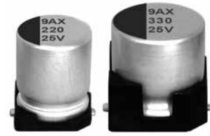
表示色 : ケース頭部に青色印刷