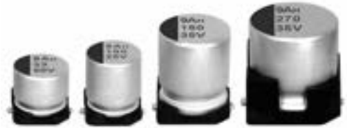
表示色 : ケース頭部に青色印刷